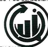
SELLO Y FIRMA Asesoría y Logística en Comercialización S.A. de C.V.

NOTA: EL SURTIMIENTO EXTEMPORÁNEO DE ESTA ORDEN DE COMPRA CAUSARÁ UNA PENALIZACIÓN DEL 3 AL MILLAR POR CADA DÍA DE ATRASO, SIN PERJUICIO DE LO ESTABLECIDO EN EL CONTRATO.