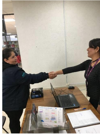
Presentarse ante el Ciudadano