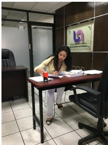
Revisión de Área y equipo de trabajo