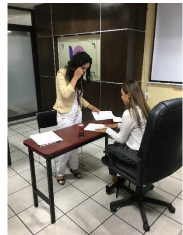
Proporcionando la información del servicio