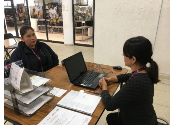
Proporcionando la información del servicio