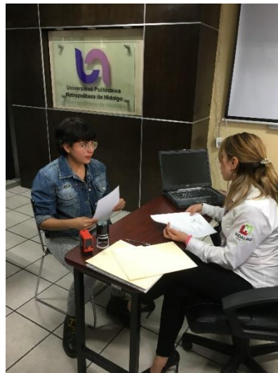
Entrega de servicio Solicitado