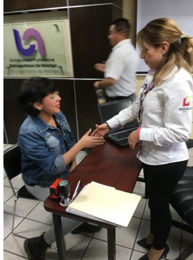
Presentarse ante el Ciudadano