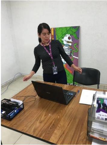
Revisión de Área y equipo de trabajo