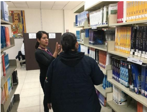
Gestiona la solicitud del servicio