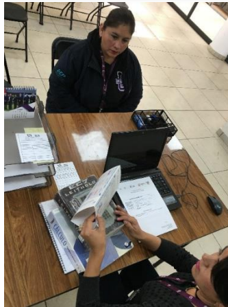
Entrega de servicio Solicitado