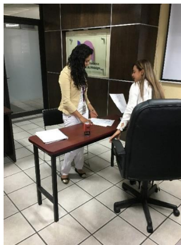
Presentarse ante el Ciudadano