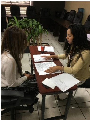
Gestiona la solicitud del servicio