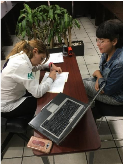
Gestiona la solicitud del servicio