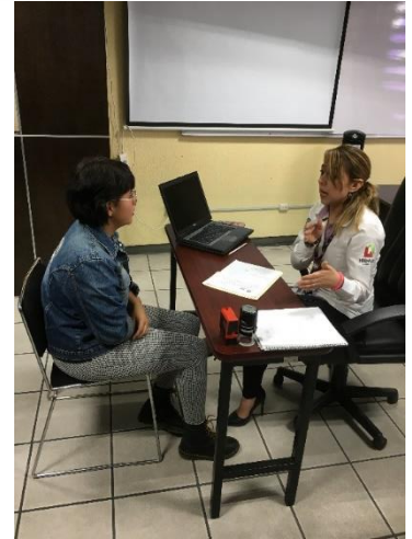
Proporcionando la información del servicio